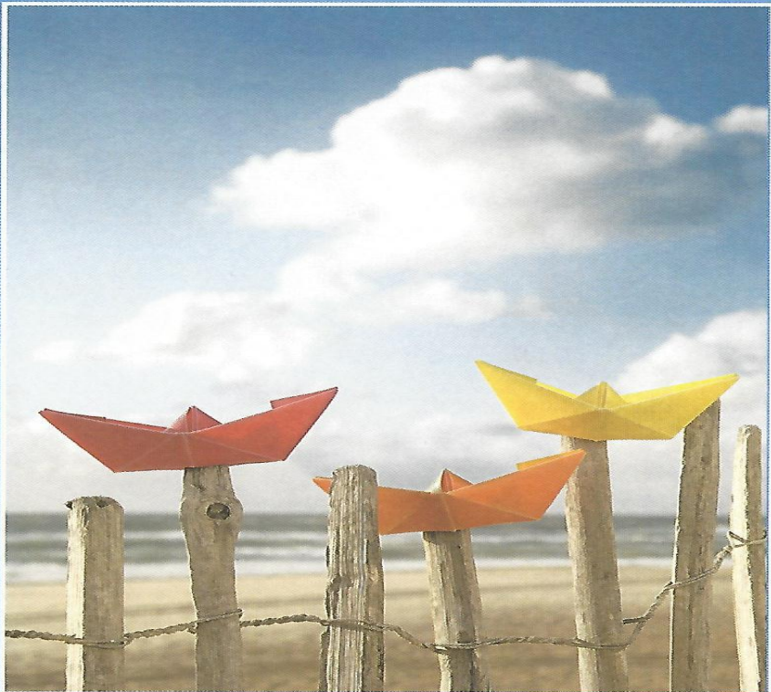
Auf Sommerkurs